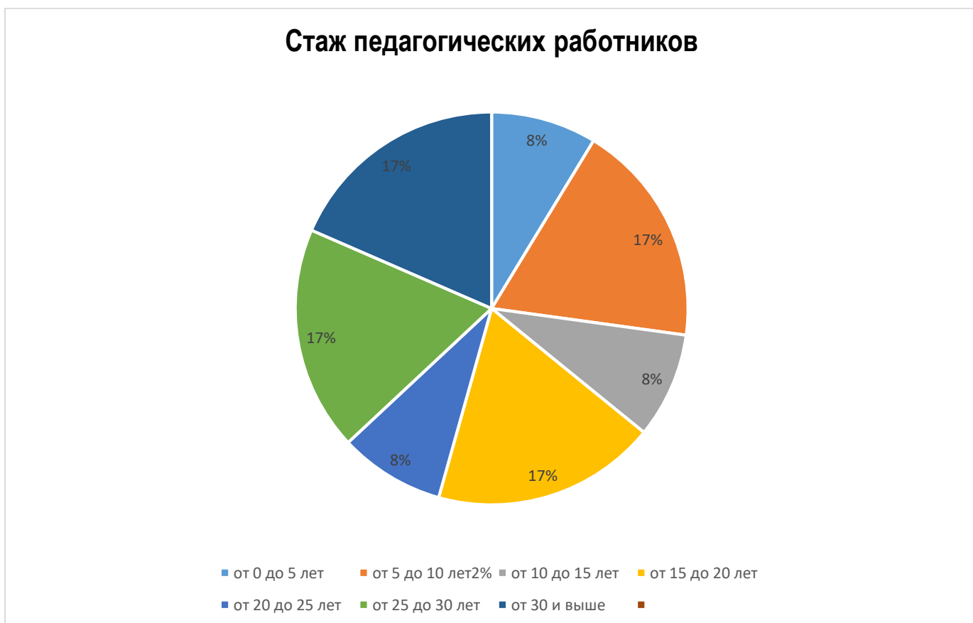
Диаграмма с характеристиками педагогического состава МБДОУ.

Курсы повышения квалификации в 2025 году прошли 6 педагога.